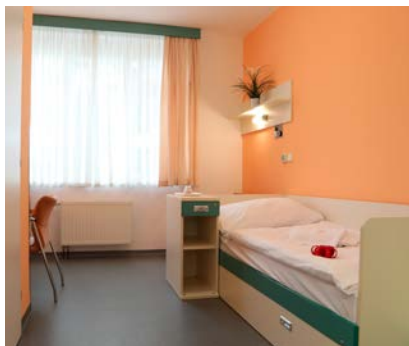
Jednolůžkový pokoj v LD Bečva.

V Lázeňském domě Bečva se nachází také Odborný léčebný ústav pro kardiorehabilitaci, který je vybaven moderními zdravotnickými přístroji. Pro komfort klientů je zajištěno zázemí se všemi potřebnými službami, které jsou pod jednou střechou. Lázeňský dům Bečva, který byl postaven ve funkcionalistickém stylu, leží v samot-