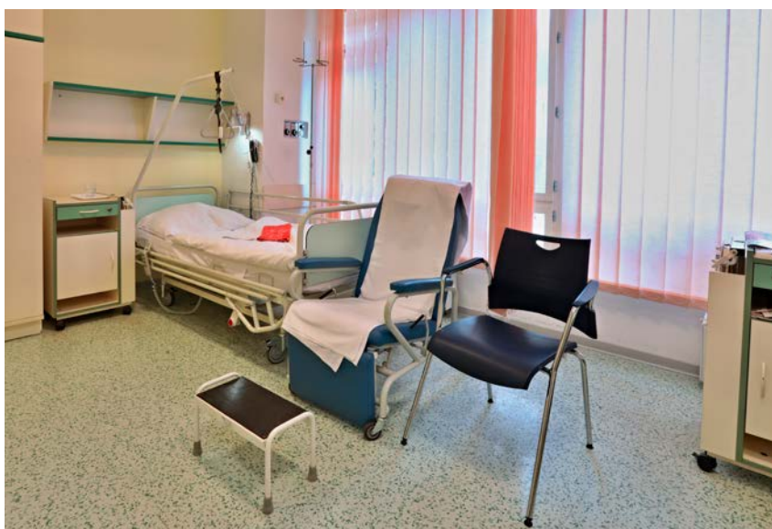
Pokoj s intenzivní péčí v Odborném léčebném ústavu v Lázeňském domě Bečva.

Jedná se o soubor léčebných a dietních opatření v životním režimu nemocného, které navazují na kardiochirurgickou operaci a které u nemocného zpomalí nepříznivý průběh již vzniklé nemoci se snahou o zamezení opakování akutní příhody nebo operace. Pro zvýšení fyzické výkonnosti se pacienti účastní tréninkového programu. Aby byla snížena bolestivost kloubů, svalů a pooperačních jizev, jsou pacientům poskytovány vodoléčebné a elektroléčebné procedury a uhlíčitě koupele. Pravidelně jsou prováděna všechna nutná kontrolní vyšetření a nemocní jsou pod stálým od-