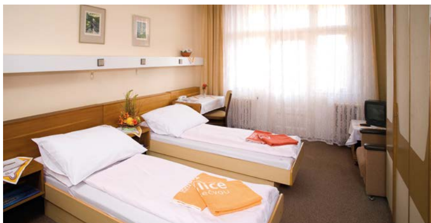
Ubytování v Lázeňském domě Janáček.

Je pravda, že prostředí také pomáhá léčit. K procházkám doporučujeme rozlehlý lázeňský park, stezku kolem řeky Bečvy a okolní lesy. I když pro pacienty krátce po operacích nosných kloubů, kteří chodí ještě s francouzskými holemi, náš zvlněný terén není ideální, pro většinu ostatních pacientů, zvláště pro vertebropaty (pacienty s onemocněním páteře) je právě nerovný měkký terén v lese ideální.