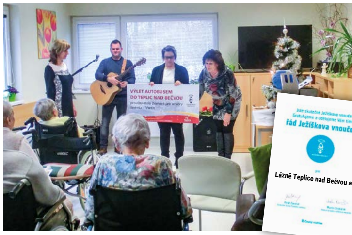
Za tento krásný počín dostaly Lázně Teplice nad Bečvou od týmu Ježíškových vnučat z Českého rozhlasu řád Ježíškova vnučete.

Do projektu Českého rozhlasu Ježíškova vnučata se jako dárci zapojily i Lázně Teplice nad Bečvou. V pondělí 17. prosince v pravé poledne předali zástupci lázní obrovský voucher obyvatelům Domova pro seniory Jasenka ve Vsetíně, kterým tak splnili jedno z letošních přání – výlet autobusem do Lázní Teplice nad Bečvou.