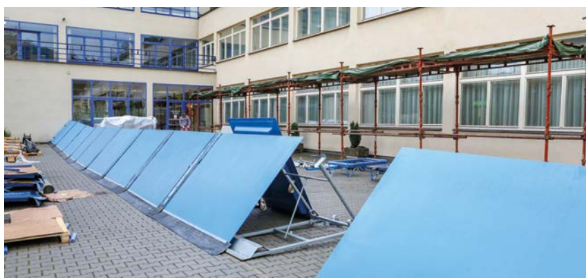
Montáž protipovodňových opatření před Lázeňským domem Bečva.

Město Hranice připravuje rekonstrukci své protipovodňové ochrany, a to její navýšení na přibližně 50ti letou vodu. Proto se i v Lázních Teplice nad Bečvou rozhodli zhotovit mobilní hrazení, které je dimenzováno na vodní hladinu o 15–20 cm vyšší oproti poslední povodni z roku 2010. Tomu předcházela studie míry zaplavení povodňovou vodou v uvedeném roce 2010, prohlédnutí dostupných videozáznamů a fotodokumentace povodní.