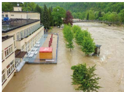
Povodeň v roce 2010.

„Nové protipovodňové zábrany kolem LD Bečva se dají postavit za dvě až tři hodiny a díky současnému monitoringu hladiny řeky Bečvy jsme dnes schopni vědět čtyři hodiny dopředu, že stoupá její hladina, nebo že k nám jde větší vlna. Při poslední povodni v roce 2010, kdo měl volné ruce a nohy, tak pytlouval, a stejně jsme se neubránili. Naštěstí se na obou březích Bečvy dělají takové terénní úpravy, aby případná voda nebyla vyšší než 50ti letá. Naposledy jsme zde měli vodu ve zmiňovaném roce 2010, ale jinak téměř každý rok se hladina řeky pohybuje na hranici koryta a kolonády, což představuje první nebo druhý povodňový stupeň. Doufáme, že nové zábrany budeme potřebovat pouze při nácviu jejich stavění, ale na velkou vodu musíme být připraveni,“ uzavírá vedoucí technického provozu a údržby lázní Zdeněk Růžička.