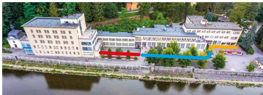
Grafické zobrazení protipovodňových opatření.